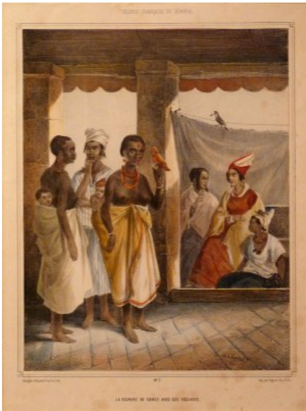
« La signare de Gorée avec ses esclaves »

Leur existence s'explique d'abord dans le contexte de la Traite. Un traitant faisait du commerce. Il était en deçà des négociants. Ce terme caractérise aussi un commerce particulier : celui des êtres humains. La zone sénégalaise fut concernée par ce commerce. Il y a assez peu d'éléments pour savoir si les signares participèrent à la traite négrière. Il semblerait qu'elles n'y aient pas participé, à défaut de source à ce sujet. Cependant, elles possédaient des esclaves. Certaines signares avaient été elles-mêmes des esclaves. C'était un esclavage africain, local, présent partout dans l'Afrique de l'Ouest. On parle de « captifs de cases ». Il ressemblait plus au servage médiéval qu'à l'esclavage tel qu'il existait dans les plantations du « Nouveau monde ».