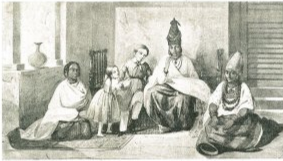
Fig. 9.—INTÉRIEUR DE SIGNARE (d'après le tableau de Bonin).

langues, les coutumes locales, sur les manières éventuellement de se protéger contre les dangers du climat, les réseaux marchands et les réseaux de pouvoir sur la terre ferme. Cela permettait aux Européens de connaître les bons interlocuteurs. La mortalité des Européens était importante. Lorsque l'Européen survivait, il repartait en métropole. Il s'agissait donc d'un mariage temporaire. Il y avait alors une cérémonie où la signare allait sur la plage, versait du sable. Cela lui permettait de se remarier « à la mode du pays », quelques temps après, avec un autre Européen, en prenant le nom à chaque fois du nouvel arrivant.