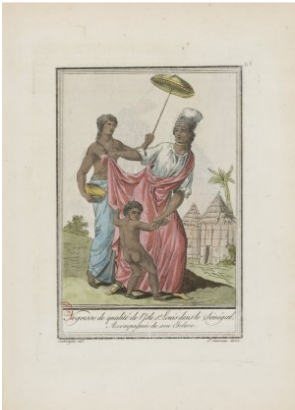
« Nègresse de qualité de l'Isle S.t Louis dans le Sénégal, Accompagnée de son Esclave »

Les Portugais arrivèrent au milieu du XV e siècle, et notamment au niveau du fleuve Sénégal vers 1444 pour atteindre la Sierra Leone en 1460. L'archipel situé à l'Ouest du Cap vert était important, car, pendant longtemps, les Portugais ne s'installèrent pas réellement sur la côte, mais sur ces îles qui leur servaient de base. Ils s'installèrent également au niveau de la Côte de l'or, où ils construisirent le fort Saint Georges de la Mine. Les Portugais ne s'étaient donc pas installés rapidement sur le continent. Cependant, ils utilisèrent des renégats, des personnes condamnées, emmenées sur leurs navires de découvertes, pour aller sur le continent. Soit ils périssaient rapidement, soit ils faisaient souche. Dans ce dernier cas, ils servaient d'intermédiaire entre les sociétés africaines et les Portugais présents pour pratiquer différents types de commerce.